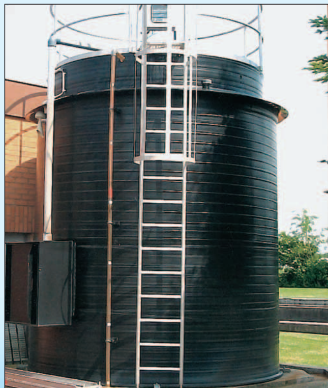
formoplast Lagerbehälter mit Auffangvorrichtungen aus PE-HD für Fällungsmittel auf Kläranlagen Nutzinhalt: 25.000 Liter, Durchmesser: 3.000 mm, Bauhöhe: 4.700 mm