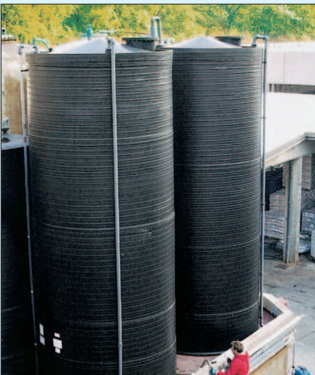
formoplast Lagerbehälter aus PE-HD, in bauseitiger Auffangwanne, Inhalt: 75%-ige Phosphorsäure, Nutzinhalt: 50.000 l, Durchmesser: 3.000 mm, Höhe: 7.500 mm