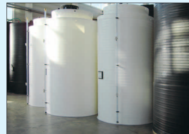
Lagerbehälter aus PE-natur (lebensmittelecht)