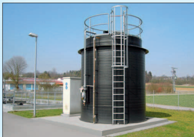
Kläranlage Laichingen, Schwäbische Alb

Zur Energieeinsparung werden die Flachboden-Behälter isoliert.