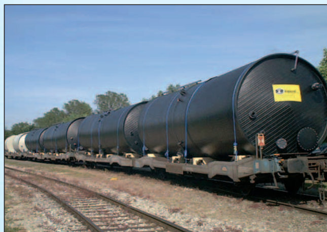
Großbehälter-Transport auf der Schiene

Mit einem Produkt aus dem Hause formoplast haben Sie die Gewähr, die gesetzlichen Bestimmungen zu erfüllen.