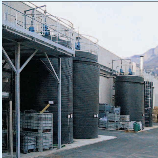
formoplast Lagerbehälter mit Auffangvorrichtungen aus PE-HD Inhalt: 50%-ige Natronlauge, 50%-ige Salpetersäure und 96%-ige Schwefelsäure Nutzinhalt: 30.000 Liter, Durchmesser: 2.800 mm, Bauhöhe: 5.280 mm

Das L agern, A bfüllen und U mschlagen von wassergefährdenden Flüssigkeiten unterliegt strengen gesetzlichen Vorschriften. Das gleiche gilt für Anlagen, die dem H erstellen, B ehandeln und V erwenden dienen.