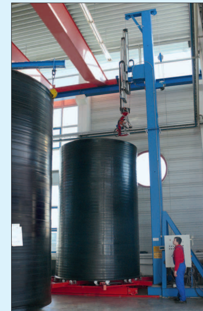
Extrusionsschweißautomat zum Verbinden des Zylinders mit dem Behälterboden